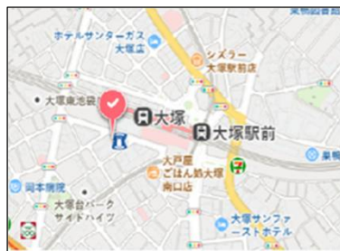
JR「大塚」駅南口 徒歩1分