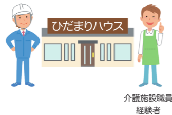
介護施設職員 経験者

建設業の会社が新たに介護業を始めるため、介護事業の経験者を施設長として雇用した。