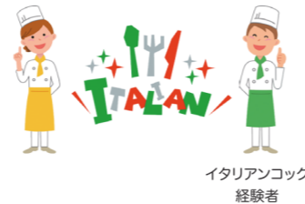
イタリアンコック 経験者

フレンチレストランが新たにイタリアンレストランをオープンするため、イタリアンのコックを雇用した。